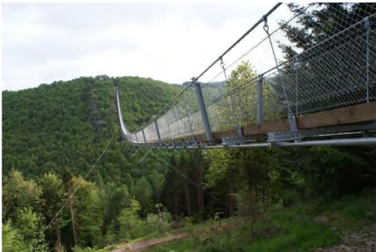
Beispielfoto: Geierley- Hängebrücke, Mörsdorf Hunsrück